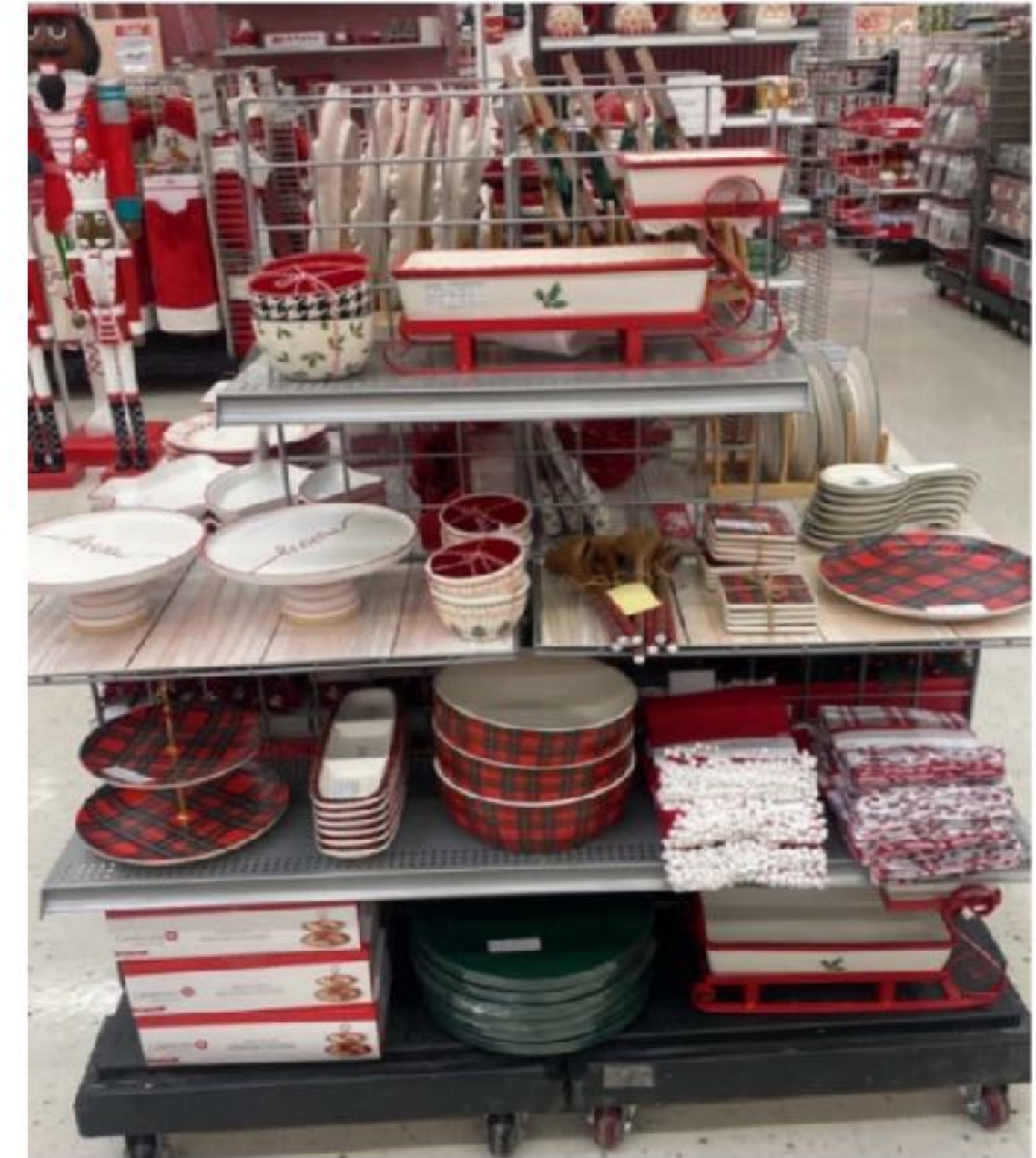
Michael's 店中店; 位於門市主通道的核心位置